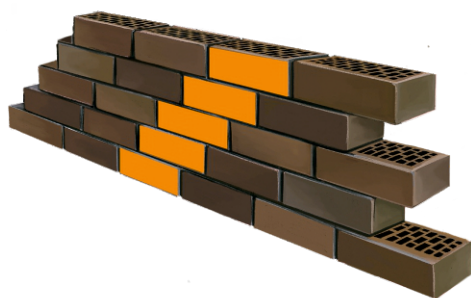
3 ЛОЖКОВАЯ КЛАДКА КОСОЕ СМЕЩЕНИЕ НА 1/4 КИРПИЧА