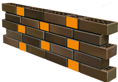
1 ЦЕПНАЯ КЛАДКА