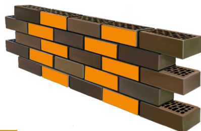
2 ЛОЖКОВАЯ КЛАДКА СМЕЩЕНИЕ НА 1/2 КИРПИЧА